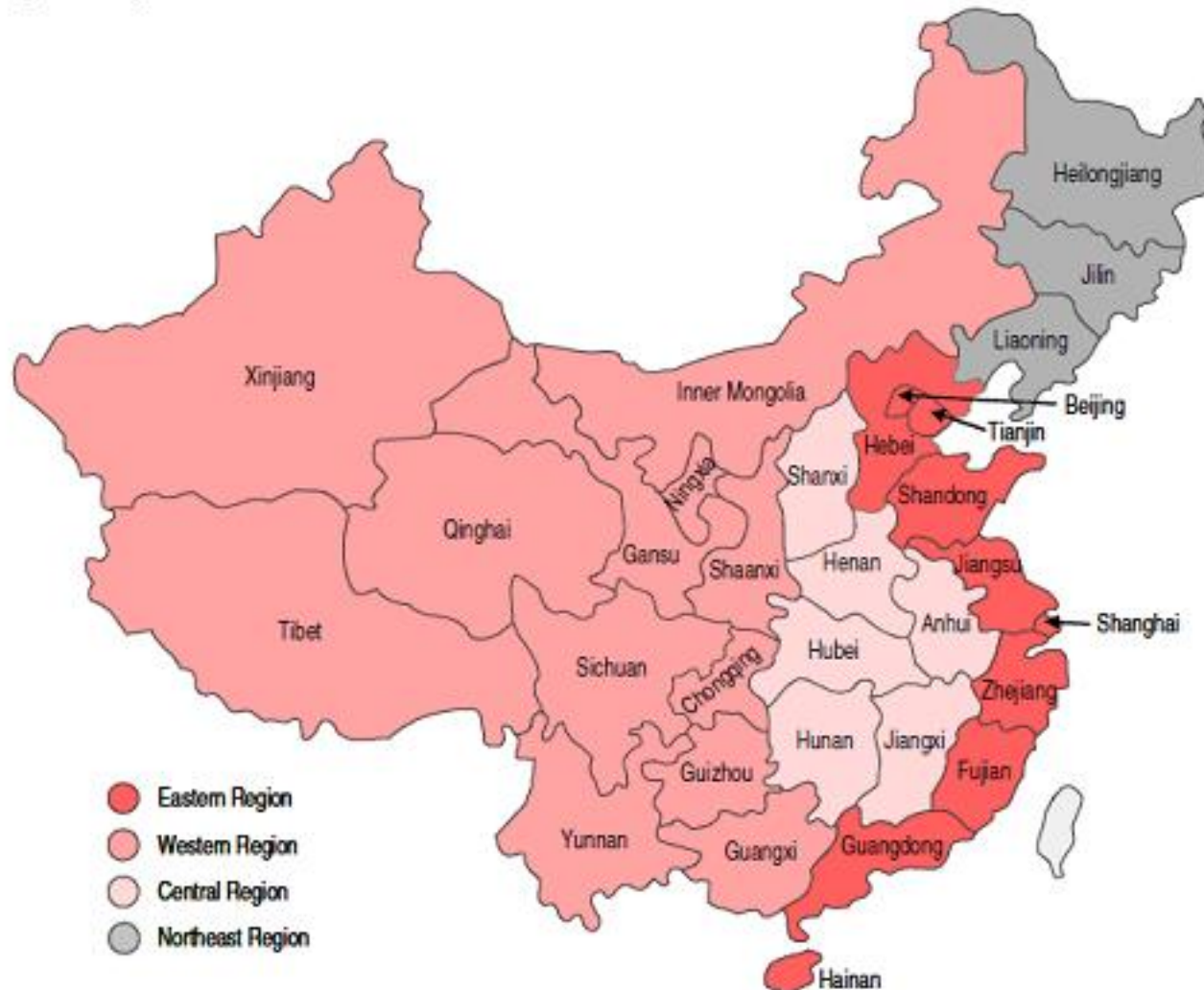
China's regions and provinces